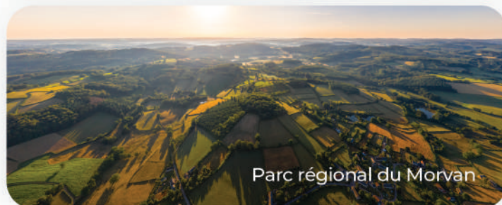
Parc régional du Morvan