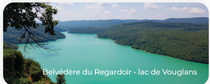
Belvédère du Regardoir - lac de Vouglans