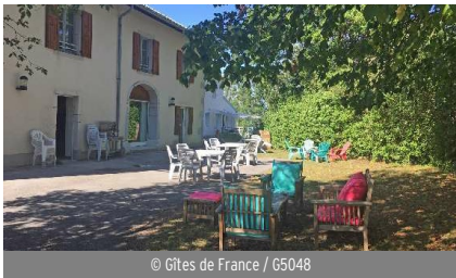
© Gîtes de France / G5048